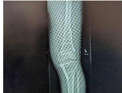
Osteosynthese li. Knie